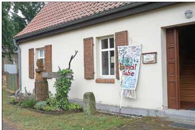
Außenansicht der Heimatstube Söllichau. Dübener Heide